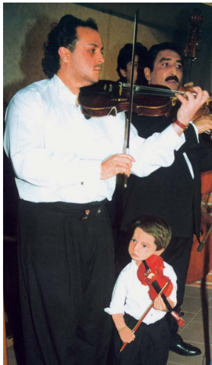
Nő a primás utánpótlás

ti szervek közötti koordináció biztosítására 1999-ben felállt a Cigányügyi Tárcaközi Bizottság. Az intézkedéscsomag keretében a minisztériumok évről évre egyre nagyobb összegeket fordítanak feladataik megvalósítására (2000-ben 4,85 milliárd Ft, 2001-ben 5,2 milliárd Ft, 2002-ben 7,4 milliárd Ft).