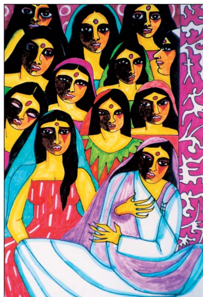
Szécsi Magda író, költő, festőművész képei