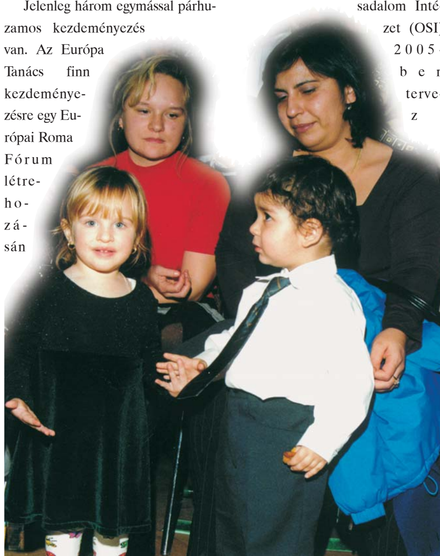
Első szerelem, előítélet nélkül

Jelenleg három egymással párhuzamos kezdeményezés van. Az Európa Tanács finn kezdeményezésére egy Európai Roma Fórum létrehozásán