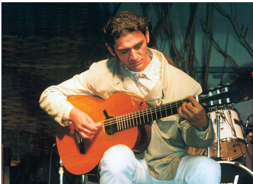
Snétberger Ferenc gitárművész

A kommunista párt, a Magyar Szocialista Munkáspárt határozata 1961-ben látott napvilágot, és a következő évtizedekre meghatározta a cigánypolitika elvi alapjait. A határozat a cigánykérdést nem nemzetiségi, hanem szociális problémaként fogalmazta meg: „A cigánylakosság felé irányuló politikában abból az elvből kell kiindulni, hogy bizonyos néprajzi sajátossága ellenére sem alkot nemzetiségi csoportot.” „Sokan nemzetiségi kérdésként fogják fel, és javasolják a »cigány nyelv« fejlesztését, cigány nyelvű iskolák, kollégiumok, cigány termelőszövetkezetek stb. létesítését.