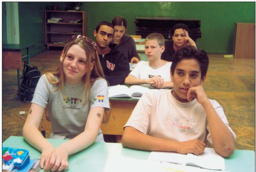
A budapesti Hernád utcai iskola tanulói

fiatalok 90 százaléka végzi el az általános iskolát, a végzettek 85 százaléka továbbtanul valamilyen középfokú tanintézetben. Az utóbbi években 9 százalékról 15 százalékra nőtt az érettségit adó középfokú intézményekben tanuló roma diákok aránya. Kedvezőtlen viszont, hogy a