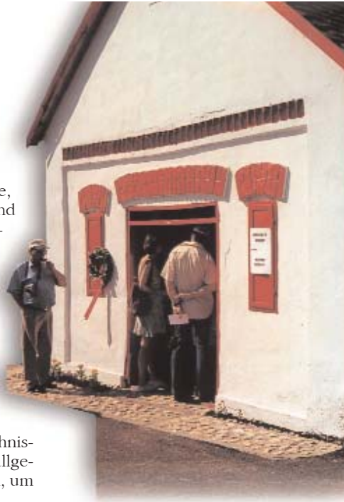
Deutscher denkmalgeschützter Keller in Palkonya (Palkan)

In den letzten Jahren setzen sich in der Gesetzgebung der Republik Ungarn die Minderheitenaspekte immer mehr durch, es entstehen Gesetze, die auch aus der Sicht der Garantie der konstitutionellen Rechte der Minderheiten den Ansprüchen