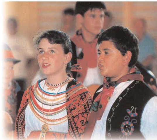
Jugendliche kroatischer Nationalität in Volkstracht

Das Gesetz LXXVII vom Jahr 1993 über die Rechte der Nationalen und Ethnischen