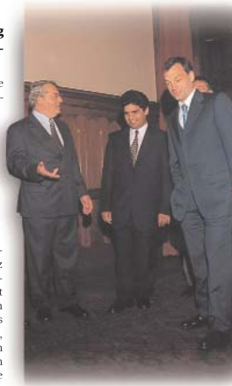
Ministerpräsident Viktor Orbán empfängt den Vorsitzenden der Landesselbstverwaltung der Roma, Flórián Farkas am 17. Juni 1999. Links im Bild der Vorsitzende des Amtes für Nationale und Ethnische Minderheiten, Toso Doncsev

Für die Roma-Politik der ungarischen Regierung ist eine auf die Ergebnisse der früheren Jahre basie-