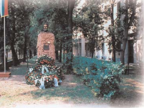
Büste des bulgarischen Dichters Christo Botew in Budapest

Der ungarische Staat fördert den Aufbau der Massenmedien der Minderheiten. Der Ungarische Rundfunk strahlt seit 1998 für 13 Minderheiten Sendungen aus und beim öffentlich-rechtlichen Ungarischen Fernsehen werden auch für alle 13 Minderheiten Programme gefertigt. Die Fernseh-