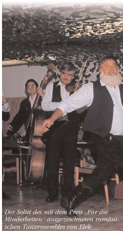
Der Solist des mit dem Preis „Für die Minderheiten“ ausgezeichneten rumänischen Tanzensembles von Elek

Die Wahl der Minderheitenselbstverwaltungen wird gleichzeitig mit den Kommunalwahlen abgehalten. An den Wahlen kann sich jeder Wahlbürger der Siedlung beteiligen und für die Kandidaten der Minderheit stimmen. Die Tatsache, dass im Gegensatz zu den Wahlen der Minderheitenselbstverwaltungen von 1994 und 1995 (Gründung von 822 Minderheitenselbstverwaltungen) nach den Wahlen von 1998 lan-