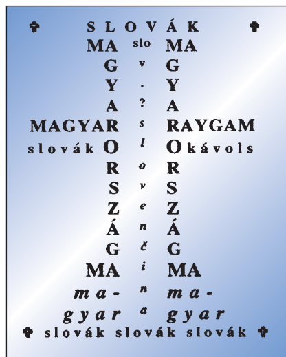
Bildgedicht von Imre Fufl „Ukrizovanie“ (Kreuzigung)

Die Gemeinnützige Stiftung für die Nationalen und Ethnischen Minderheiten in Ungarn wurde zur Unterstützung von Programmen und Presseorganen ins Leben gerufen, die sich zum Ziel setzen, dass die in Ungarn beheimateten Minderheiten ihre Identität bewahren, ihre Traditionen,