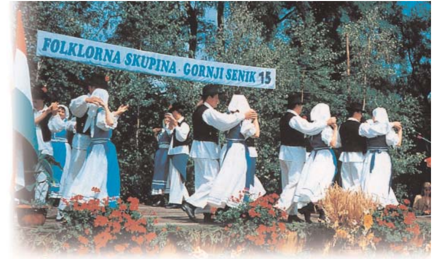
Slowenisches Fest in Felsőszölnök (Gornji Senik)

Von drei Fragen der Volkszählung 1990 konnte man auf die nationale Zugehörigkeit folgern – diese waren: Nationalität, Muttersprache sowie gesprochene Sprache. Diese drei Kriterien beinhalten bei den Minderheiten in Ungarn Informationen mit unterschiedlicher Aussage hinsichtlich der ethnischen Zugehörigkeit. Die Deklaration der Minderheitenzugehörigkeit setzt nämlich nicht gesetzmäßig die Kenntnis der Muttersprache der Minderheit voraus. Unter Muttersprache verstehen wir die in der Kindheit angeeignete und im allgemeinen in der Familie gesprochene Sprache, doch bekennt sich gleichzeitig eine Teil der Bevölkerung, der die Sprache einer Minderheit als Muttersprache spricht, zur ungarischen Nationalität. Über diese beiden Kriterien hinaus kann auch die Erwägung der Sprache außer der Muttersprache ein wichtiger Informationsträger sein, wenn die Sprache der Minderheit nicht als häufig erlernte, populäre Weltsprache zählt. Diese Zahlen weisen jedoch nicht nur auf die Minderheit hin, die sich nicht bekennt,