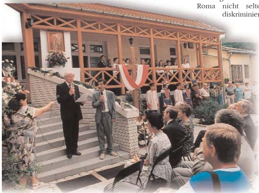
Festliche Übergabe des Sitzes der Landesselbstverwaltung der Polnischen Minderheit am 27. Juni 1998

Die komplexe Annäherung legt in folgenden Bereichen Aufgaben fest: Unterricht, Kultur, Beschäftigung, Agrarwirtschaft, Regionalentwicklung,