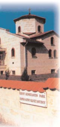
Orthodoxe Kirche im griechischen Dorf Beloianisz

sendungen in der Muttersprache werden zweiwöchentlich mit Magazinprogrammen über die Minderheiten in ungarischer Sprache ergänzt, die sich das Ziel setzen, auch die Mehrheitsbevölkerung zu informieren. Die Landesselbstverwaltungen der nationalen und ethnischen Minderheiten entscheiden