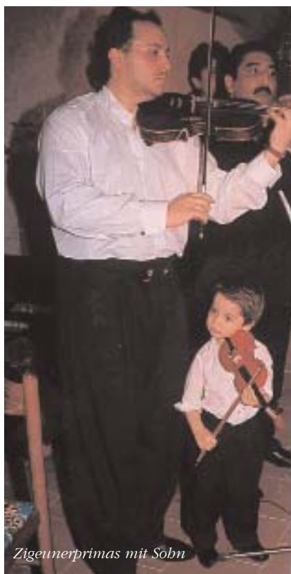
Zigeunerprimas mit Sohn

Mangels entsprechender Lehrkräfte, bzw. weil die Kenntnis der Muttersprache unter den Kindern nicht entsprechend ist, sowie aus unterschiedlichen anderen Gründen ist die Zahl der Schulen von letzterem Typ leider sehr gering.