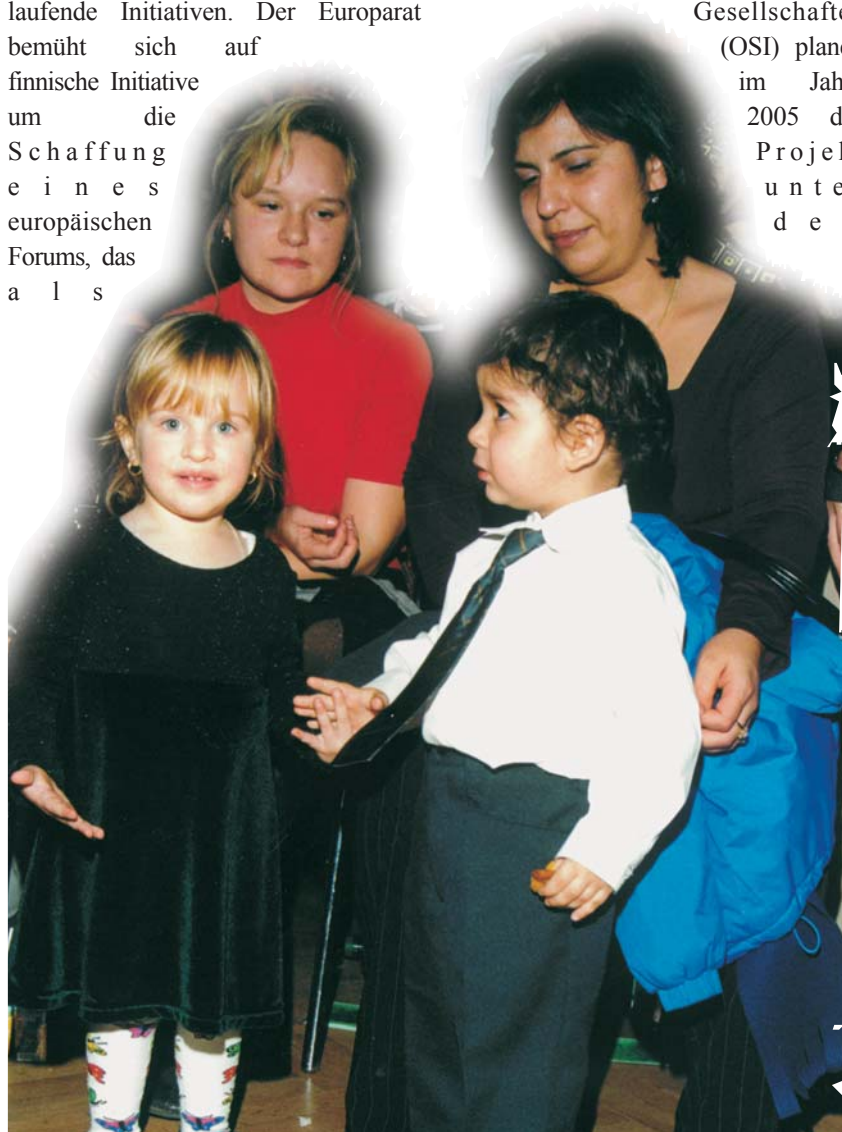
Die erste Liebe - ohne Vorurteile

Maßnahmen im Interesse der Schaffung der gesellschaftlichen Integration und der Chancengleichheit der Roma zusammenfaßt und der die gesamten Regierungssphären umfaßt. Der Ministerrat der OSZE nahm den Aktionsplan am 1. und 2. Dezember 2003 auf der Maastrichter Sitzung an. Die dritte Initiative bezieht sich auf die neun Länder von Mittel- und Südosteuropa. Die Weltbank und das Institut für offene Gesellschaften (OSI) planen im Jahre 2005 das Projekt unter dem