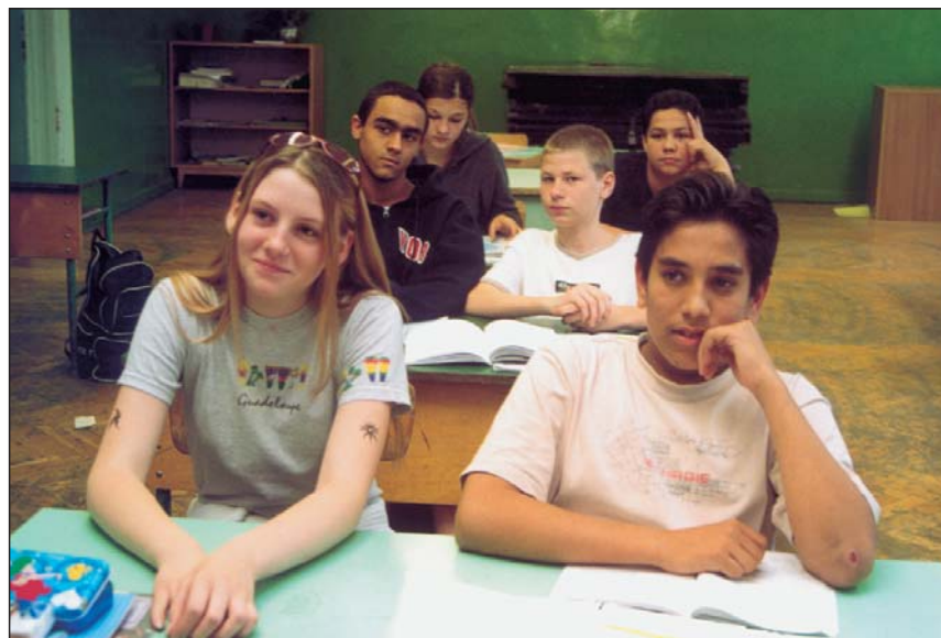
Die Schüler der Schule an der Hernád Strasse

gefördert. In den letzten Jahren ist die Zahl der Stipendiaten sprunghaft angestiegen: im Jahre 1998 waren es 750, im Jahre 2001 12.000, im Jahre 2003 erhielten schon 19.000 junge Roma ein Stipendium. Mit Unterstützung des Bildungsministeriums werden an mehreren höheren