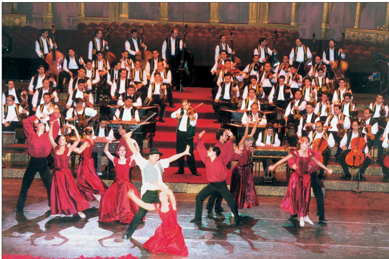
"Romaniade" - Eine Produktion des Kinderorchesters "Rajkó" und des "Győri Balett". Choreograph: Iván Markó

Die Romapolitik wurde auch auf Regierungsebene neu bestimmt, die im Sommer 2002 gebildete Regierung formulierte als vorrangige Aufgabe die Förderung der gesellschaftlichen Chancengleichheit der Roma. In Verbindung damit erfolgten bedeutende organisatorische Umstrukturierungen: Die Romaangelegenheiten gelangten erneut unter die unmittelbare Leitung des Amtes des Ministerpräsidenten neben der gleichzeitigen Schaffung des