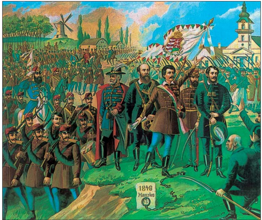
描写1848年革命英雄形象的平板印刷画。从左至右：将军贝姆·尤若夫、总理伯加尼·劳约什、诗人裴多菲·山多尔、将军克拉普卡·捷尔杰、革命领袖科苏特·劳约什。

治上的独立、解放农奴、取消贵族特权、确立承认公民财产的法律平等权并创立独立的民族工业。总而言之，他们要求开始资本主义改