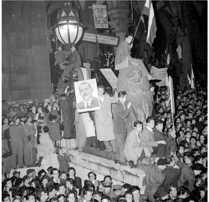
1956年的革命群众在国会大厦前聆听纳吉·伊姆雷的讲话

晨，苏军为镇压革命发动了全面进攻。在压倒性的军事优势攻击下，武装抵抗被镇压下去了。通过电台广播，卡达尔·亚诺什宣布成立亲苏的匈牙利政府。革命和自由斗争被镇压后，许多人被投入监狱，另有数百人被处死，其中包括1958年被处决的纳吉·伊姆雷及国防部长莫雷特·帕尔。在数月内，共