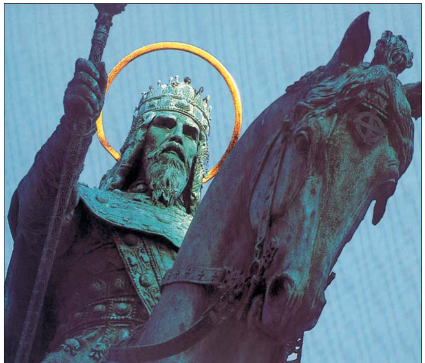
国家奠基人圣·伊什特万国王塑像

大千世界除此之外， 并无属于你的归宿， 让命运之手保佑你打击你吧， 你需要生于此并死于此。