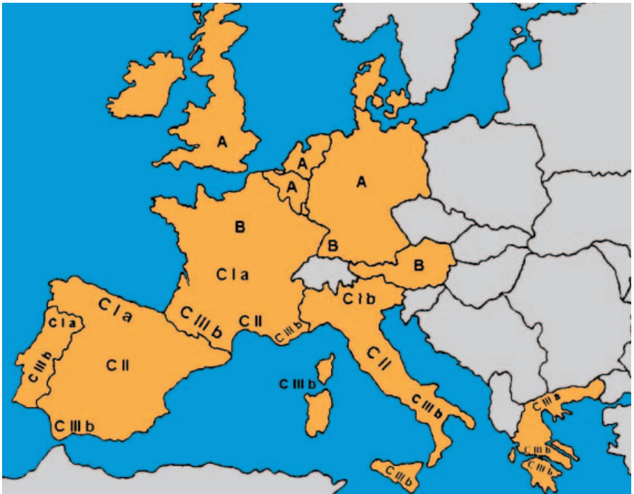
3. ábra. Az EU szőlőtermő övezetei

A szakmai szervezetek elsődleges célja hasonló a termelői szervezetekéhez. Mivel a termelői szervezetek csak korlátozott határok között képesek a kereslet és a kínálat összehangolására, célszerű a piaci szereplők között magasabb szintű megállapodásokat létrehozni. A kínálatszabályozó értékesítési szabályok (szakmaközi megállapodások) a szakmaközi együttműködés, vagyis az egyes piaci szerep-